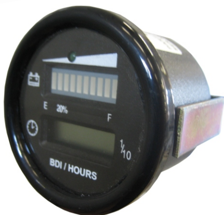
BDI con contaore e diagnostica BDI with hour meter and diagnostic led