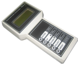
Calibratore Adjustment console