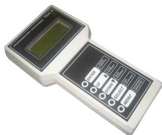
Calibratore Adjustment console